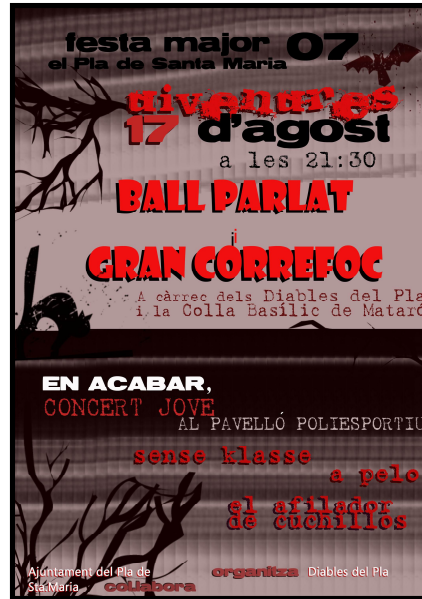
Organitza: Diablers del Pla