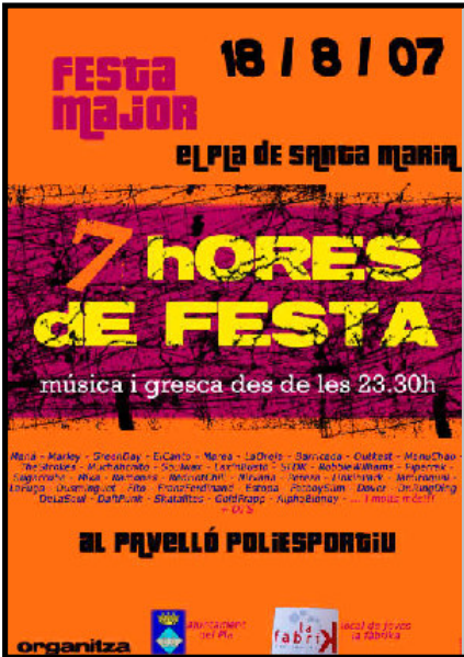
Organitza: La fàbrica